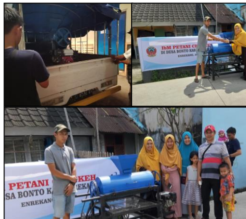
Gambar 8. Serah terima alat pemisah bunga cengkeh pada kegiatan Iptek bagi Masyarakat (IbM)

Penyerahan mesin pemisah bunga cengkeh dilakukan oleh tim IbM kepada mitra (Petani cengkeh di desa Bonto Enrekang) pada bulan kedua kegiatan pengabdian (Mei 2019). Pelaksanaan kegiatan IbM Petani Cengkeh tahun 2019 dapat dilihat pada Gambar 7 dan 8.