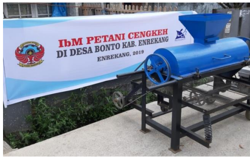
Gambar 5. Spanduk kegiatan IbM beserta alat pemisah bunga cengkeh