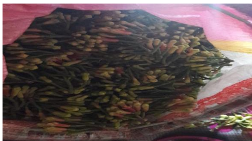
Gambar 1. Bunga cengkeh utuh dengan tangkainya