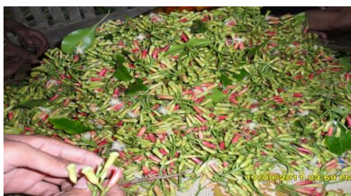
Gambar 2. Bunga cengkeh sebelum melalui proses pemisahan

Menurut petani cengkeh “Proses pemisahan bunga cengkeh dari tangkai-nya harus dilakukan pada hari pemetikan, jika lewat dari waktu tersebut maka bunga cengkeh akan rusak (berjamur dan berwarna keputih-putihan)”. Pemisahan bunga cengkeh masih dilakukan secara tradisional dengan cara tangkai dipegang kemudian bunganya digesek ditangan lain. Proses pemisahan bunga cengkeh dari tangkainya sangat penting karena dapat mempengaruhi kualitas secara keseluruhan. Keterlambatan proses tersebut menimbulkan jamur pada bunga cengkeh. Proses pemisahan yang masih konvensional tentu memakan waktu yang cukup lama dan memerlukan banyak tenaga kerja, sehingga menambah resiko terjadinya bunga cengkeh yang rusak (berjamur) akibat keterlambatan pada proses pemisahan.