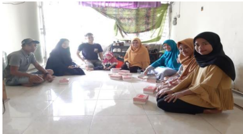
Gambar 9. Kegiatan IbM petani cengkeh

Pada kegiatan pelatihan pengoperasian dan penyuluhan perawatan mesin dilakukan juga tes uji coba mesin (Gambar 10), dimana mesin mampu berkerja dengan baik dalam memisahkan bunga cengkeh dari tangkainya dalam waktu yang lebih cepat dibandingkan cara konvensional. Hasil pemisahan bunga cengkeh tersebut dapat dilihat pada Gambar 11.