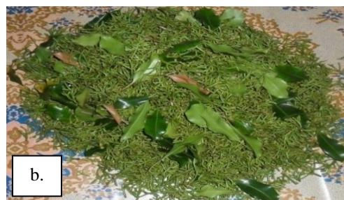
Gambar 3. Hasil pemisahan secara manual: a. bunga cengkeh dan b. tangkai bunga cengkeh (Ahmad et al., 2012)

Pengadaan mesin pemisah bunga cengkeh akan membantu mitra kami ini dalam meningkatkan kapasitas kerja 2 kg bunga cengkeh/menit dan mengurangi resiko kerusakan bunga cengkeh akibat jamur, namun mitra akan membutuhkan bimbingan dan pembekalan langsung oleh Tim Pengusul untuk mengetahui cara mengoperasikan mesin pemisah bunga cengkeh tersebut. Oleh karena itu, untuk mendukung kegiatan ini maka akan diberikan pelatihan tentang tata cara mengoperasikan mesin pemisah bunga cengkeh pada petani cengkeh di desa Bonto. Perlunya diberikan penyuluhan kepada petani cengkeh untuk melakukan perawatan mesin pemisah bunga cengkeh setelah digunakan pasca panen, agar mampu bertahan lama dan tetap prima,