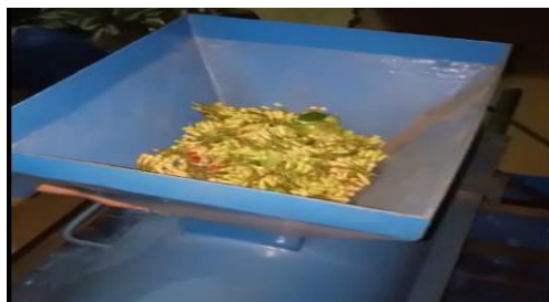
Gambar 10. Tes uji coba mesin pemisah bunga cengkeh

Pada kegiatan pelatihan pengoperasian dan penyuluhan perawatan mesin dilakukan juga tes uji coba mesin (Gambar 10), dimana mesin mampu berkerja dengan baik dalam memisahkan bunga cengkeh dari tangkainya dalam waktu yang lebih cepat dibandingkan cara konvensional. Hasil pemisahan bunga cengkeh tersebut dapat dilihat pada Gambar 11.