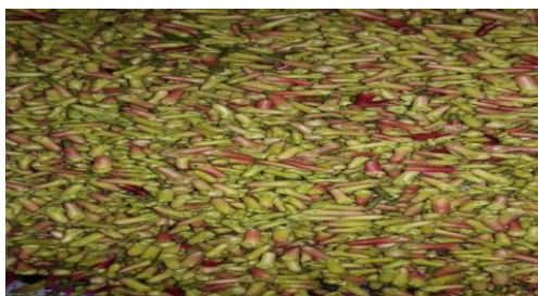
Gambar 11. Hasil pemisahan bunga cengkeh menggunakan mesin