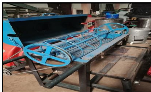
Gambar 2. Mesin pemisah bunga cengkeh

Pengadaan mesin pemisah bunga cengkeh berhasil diselesaikan pada bulan kedua kegiatan IbM (Mei 2019). Kegiatan pengadaan mesin pemisah bunga cengkeh dilakukan oleh tim pengabdian dan dibantu oleh mahasiswa Teknik Mesin PNUP. Gambar 6 memperlihatkan mesin pemisah bunga cengkeh yang telah dibuat.