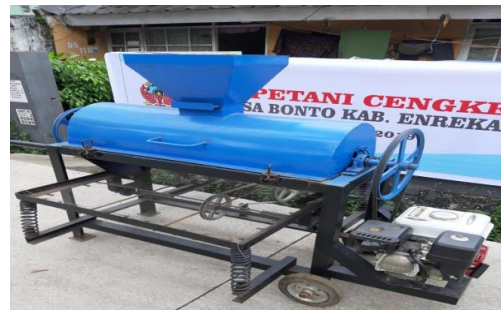
Gambar 7. Mesin pemisah bunga cengkeh di lokasi Mitra