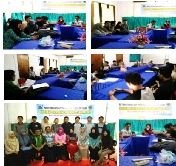
Gambar 6. Foto kegiatan Monitoring dan Pembimbingan Start-Up Usaha