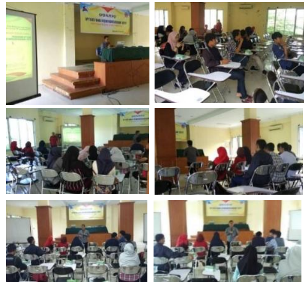
Gambar 3. Foto kegiatan sosialisasi