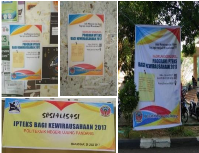
Gambar 2. Brosur, Baliho, dan Spanduk sosialisasi

Sosialisasi bertujuan menyebarkan informasi tentang adanya Program Pengembangan Kewirausahaan (PPK) yang akan dilaksanakan di Politeknik Negeri Ujung Pandang, sehingga menarik minat mahasiswa untuk mengikuti program ini. Jadwal pelaksanaan sosialisasi Tingkat Jurusan, 14 dan 21 Juli 2017, sedangkan Sosialisasi Tingkat Politeknik Negeri Ujung Pandang, 26 Juli 2017.