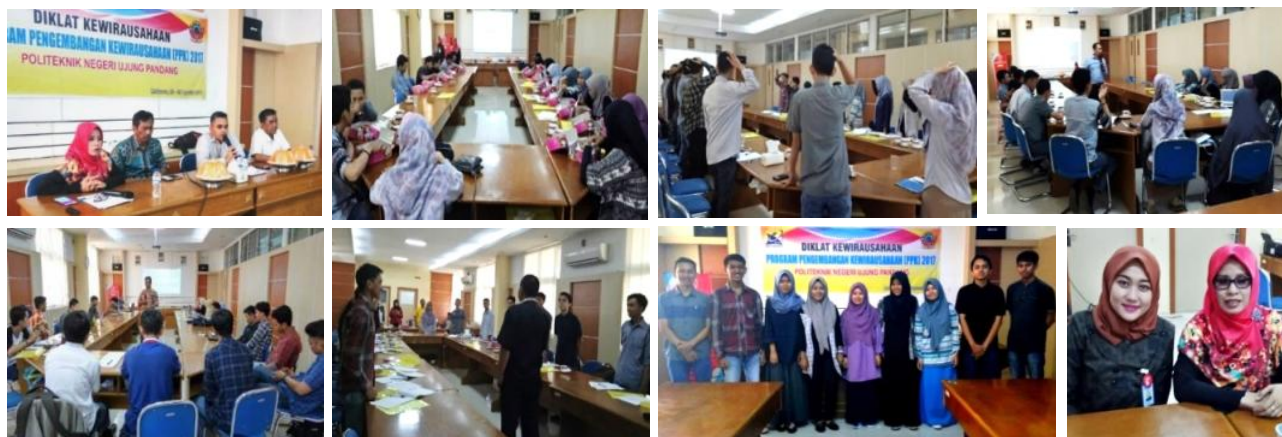
Gambar 4. Foto kegiatan Diklat Kewirausahaan

Diklat Kewirausahaan diikuti oleh 25 orang peserta. Namun, terdapat beberapa orang yang tidak melanjutkan kegiatan pelatihan karena sesuatu dan lain hal, sehingga peserta Diklat Kewirausahaan berjumlah 20 orang peserta. Selanjutnya dilakukan evaluasi hasil pelaksanaan kegiatan untuk menentukan peserta yang mempunyai keinginan kuat mengikuti Program Pengembangan Kewirausahaan (PPK) dengan menilai kerajinan selama kegiatan diklat dan rencana usaha ( Business Plan ) peserta.