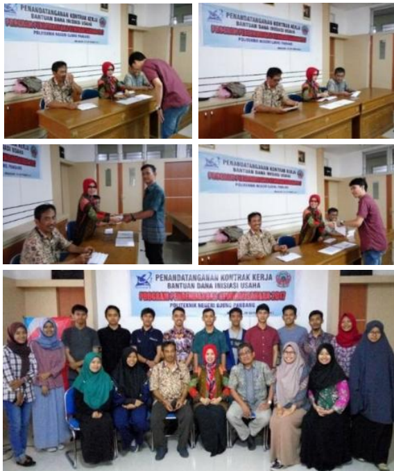
Gambar 7. Foto Penandatanganan Kontrak Kerja dan Bantuan Dana Inisiasi Usaha