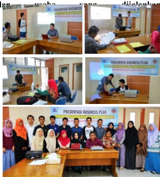
Gambar 5. Foto kegiatan Presentasi Business Plan