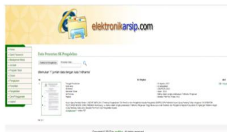
Gambar 11. Hasil Pencarian SK

Dokumen yang sudah didownload tersebut di atas dapat dicetak atau diprint.