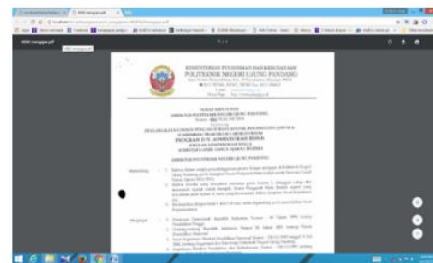
Gambar 12. Download PDF SK