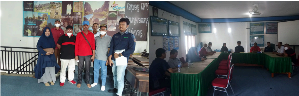
Foto kegiatan saat dilaksanakan Pelatihan PKM, bersama pemuda desa Salenrang dan dusun Rammang-Rammang sebagai pengelola desa wisata.

Foto kegiatan saat dilaksanakan Kunjungan Survey Lokasi dan Bertemu Mitra terkait persiapan pelaksanaan pelatihan, penentuan jadwal dan bahan PKM mitra yang dibutuhkan.