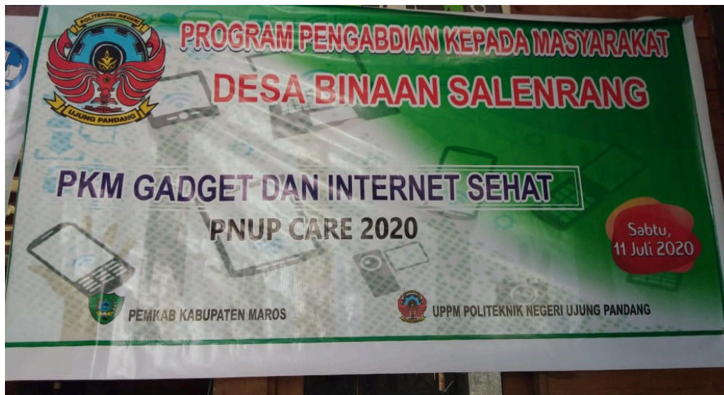
Gambar 2. Spanduk Informasi Kegiatan PKM.

Tabel 2 berikut menunjukkan hasil dan luaran pelaksanaan kegiatan PKM pda hari Sabtu, 11 Juli 2020. Persentasi pencapaian kegiatan adalah 100%.