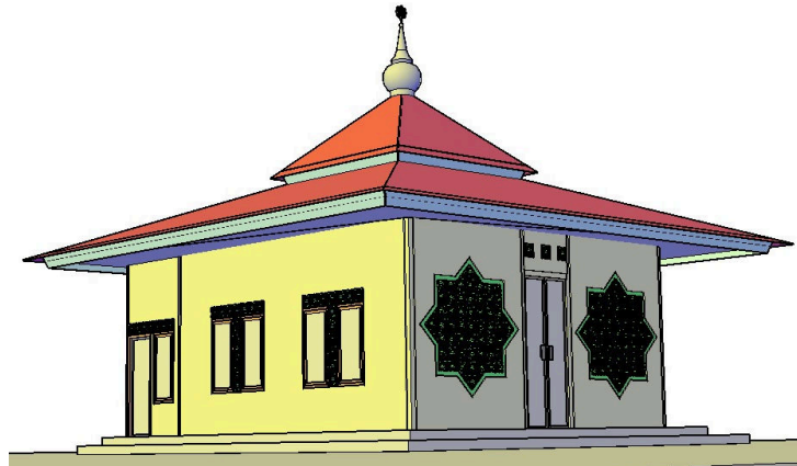
Gambar 1. Tampak Depan Kiri dari Rencana Pembangunan Masjid Kampung Massoleang

Untuk pekerjaan Dinding Bata Ringan mengacu pada denah bangunan masjid seperti pada Gambar 2 berikut ini.