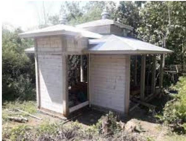
Gambar 3. Dimensi Bata Ringan

Sedangkan material dinding bata ringan berupa bata hasil pabrikasi dari industri bata yang berstandar SNI seperti bata Hebel atau Bata Ringan Kalla Beton. Untuk material utama seperti Bata Ringan pabrikasi dan mortar dibeli dari pabrik/dealer resmi bata ringan sehingga dapat menekan harga pembelian material, namun tetap memperhitungkan biaya transportasi/mobilisasi.