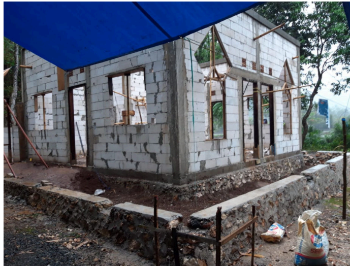
Gambar 4. Hasil Pemasangan Dinding Bata Ringan