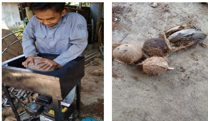
(a) (b) Gambar 3. (a) Pengujian alat dan (b) hasil pengupasan.