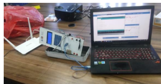
Gambar 3 Kondisi Saat Pengujian Data Logger Alat Ukur Parameter Solar Panel

Kondisi Pengujian Modul datalogger Solar Panel. Gambar 3 memperlihatkan kondisi saat pengujian modul, pengambilan data dan gambar prototipe yang telah dibuat.