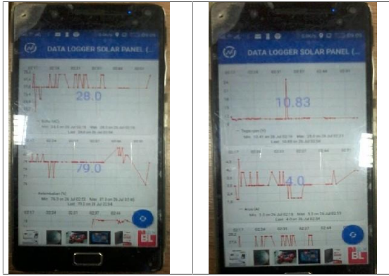
Gambar 4. Pengujian Data Pada Aplikasi Android