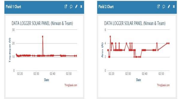
Gambar 2. Grafik Arus dan Tegangan Pada