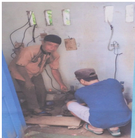
Gambar 3. Pemasangan mesin pompa air

Pada kegiatan PKM ini tertat 50 rumah yang mendapatkan distribusi air dari sumur Taipa Lohea Laloasa dusun salobundang desa bubung bundang ini dengan salah satu mesin pomp air dari tim PKM. Politeknik Negeri Ujung pandang. Adapun nama-nama kepala rumah tangga seperti terlihat pada Tabel 1.