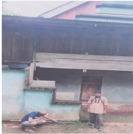
Gambar 4. Salah satu rumah pelanggan