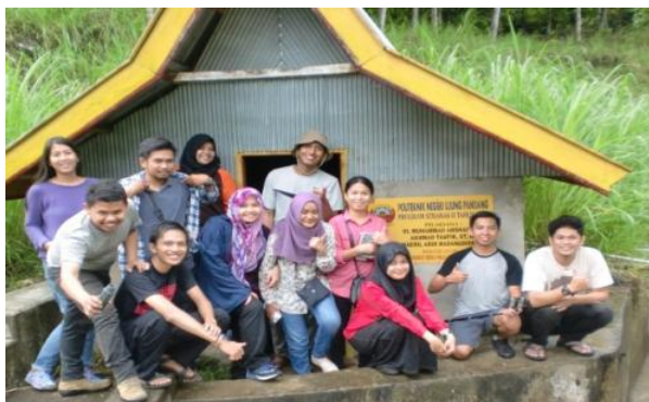
Gambar 1. Tampak Power House Mikrohidro yang dimanfaatkan mahasiswa dan masyarakat di desa Pallawa, Kabupaten Bone.

Selama Mikrohidro tersebut beroperasi, masyarakat memperoleh banyak manfaat dan dapat meningkatkan kesejahteraan masyarakat. Terjadi perbaikan kondisi masyarakat secara signifikan dalam seluruh aktivitas dalam rumah tangga. Masyarakat sudah menggunakan listrik penerangan sehingga anak sekolah termotivasi belajar setiap malam, masyarakat dapat meningkatkan wawasan, dan menikmati hiburan serta informasi melalui siaran televisi. Selain itu mereka bisa menggunakan kulkas, dan berbagai keperluan rumah tangga lainnya yang menggunakan energi listrik.