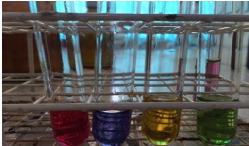
Gambar 3. Warna ekstrak pigmen kubis merah terhadap perubahan kondisi pH