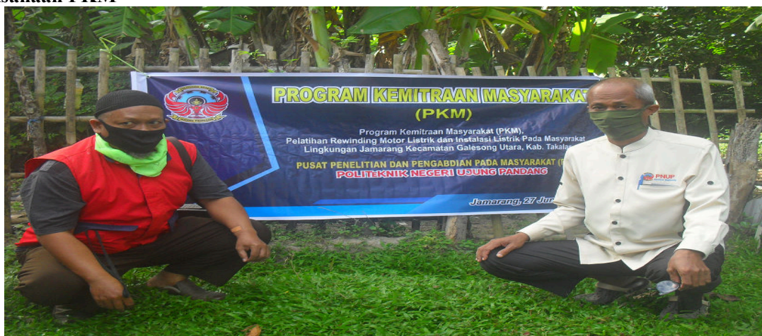
Gambar 1. Tim PKM

Pelaksanaan pengabdian masyarakat (PKM) ini dilaksanakan pada setiap ahad di bulan Juni 2020. Antusiasme masyarakat selama kegiatan kurang optimal dikarenakan masih dalam nuansa pandemi Covid 19. Tim merasa khawatir juga walaupun protokol tetap dilakukan, pengumpulan masyarakat tidak dilakukan hanya beberapa masyarakat. Sabtu 27 Juni 2020 merupakan puncak kegiatan PKM 2020. yang dilakukan pemasangan dan pengetesan motor listrik, instalasi Listrik, dan diakhiri dengan penyerahan Toolkit set ke masing-masing peserta. Dan Penyerahan 3 roll kabel untuk speaker masjid kepada ketua Panitia Pembangunan Masjid lingkungan Jamarang.