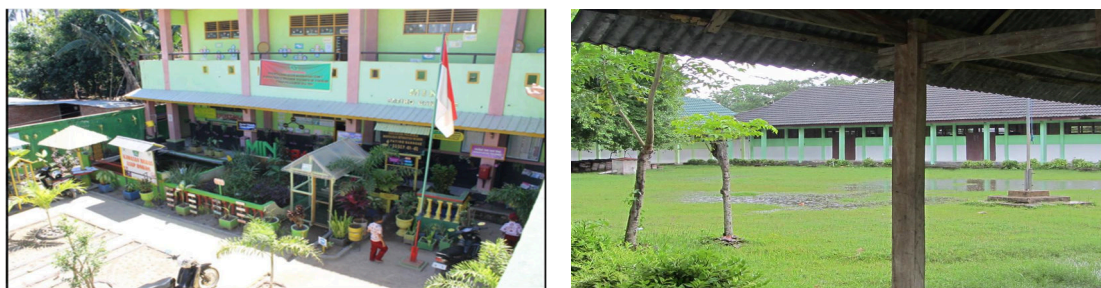
Gambar 3. Sekolah MIN, SMP 2 Mangara Bombang

Desa Banggae merupakan salah satu desa di Kecamatan Mangara Bombang Kabupaten Takalar. Mangara Bombang merupakan daerah pesisir pantai Kabupaten Takalar dilewati oleh 4 buah sungai, yaitu Sungai Jeneberang, Sungai Jenetallasa, Sungai Pamakkulu dan Sungai Jenemarrung. Sumber data yang diperoleh menunjukkan keadaan topografi dan kelerenghan Kabupaten Takalar sangat bervariasi, yang secara umum berada pada kisaran 0 - 2%, 2 - 15%, 15 - 30%, 30 - 40% dan > 40%. Kondisi topografi tersebut memiliki potensi untuk pengembangan beberapa kegiatan perekonomian masyarakat seperti pertanian, perikanan, perkebunan, peruntukan lahan permukiman dan sarana prasarana sosial ekonomi lainnya. Pada masa pandemi covid-19 masyarakat mengalami kesulitan dalam ekonomi untuk memenuhi kebutuhan disebabkan hasil penjualan komoditi pertanian, perkebunan dan perikanan menurun secara signifikan. Hal inilah yang merupakan faktor pendorong untuk semakin tingginya anak putus sekolah di wilayah tersebut. Kondisi sekolah ditunjukkan pada gambar 3.