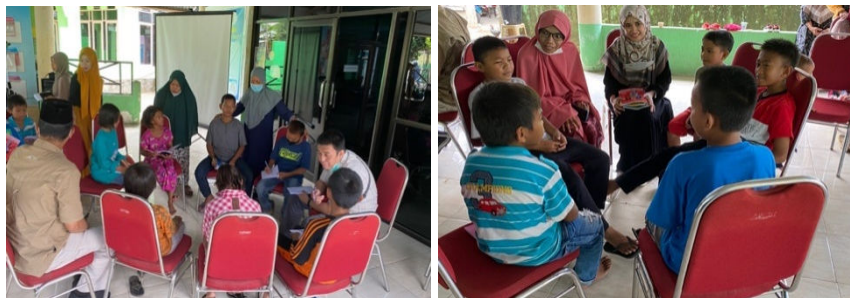
Gambar 7. Proses pelaksanaan FGD di ruang terbuka dan tertutup menggunakan metode PAKEM

Modul pembelajaran persiapan ujian paket C dan TKDA. Modul ini akan kami bagikan dalam bentuk cetak maupun file agar seluruh peserta anak putus sekolah dapat dengan mudah melalui ujian paket C dan TKDA. Pemberian pelatihan yang baik terkait modul pembelajaran ini akan sangat membantu dan memberikan kepercayaan diri untuk melanjutkan pendidikan dengan mengikuti kelas reguler atau ujian Paket C (gambar 8).