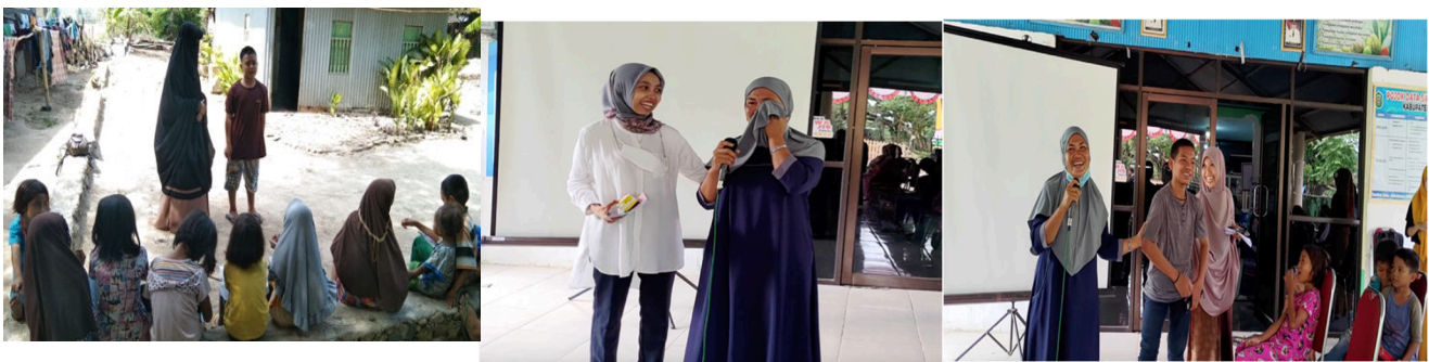
Gambar 6. Sesi Sharing bersama orang tua dan anak putus sekolah

Dalam acara workshop terdapat pula pemberian motivasi dan solusi dari permasalahan yang dihadapi oleh orang tua dan anak putus sekolah di Desa Banggae. Sharing session ini dapat dilihat pada gambar 6. Membentuk FGD yang dilakukan selama empat kali pertemuan, untuk membahas soal-soal yang terdapat dalam buku program Paket A, B, dan C dapat dilihat pada gambar 7. Memberikan tips dan trik yang cepat dan tepat dalam menjawab soal tersebut agar lulus ujian Paket A, B, dan C.