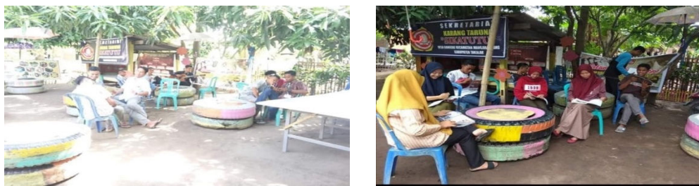
Gambar 2. Taman Baca Anak Desa Mangara Bombang

Pemerintah Kabupaten Takalar memiliki program atau Gerakan Kembali Bersekolah bagi anak-anak yang putus sekolah, bahkan bagi yang belum pernah sekolah sama sekali. UNICEF pun memiliki tujuan yang sama oleh sebab itu Pemerintah Kabupaten Takalar dan UNICEF bersinergi untuk menggalakkan Gerakan Kembali Bersekolah. Upaya dari pemerintah Desa Banggae yang sejalan dengan Pemerintah Kabupaten Takalar adalah membentuk Taman Baca Anak seperti terlihat pada gambar 2. Namun upaya ini belum menunjukkan hasil yang maksimal untuk beberapa desa pada kecamatan tertentu yang berada di pesisir pantai seperti Desa Banggae Kecamatan Mangara Bombang.