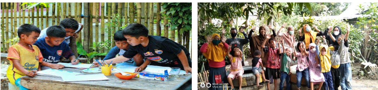
Gambar 1. Anak Putus Sekolah

Pendidikan adalah hal yang sangat penting bagi sebuah bangsa. Karena perkembangan dan kemajuan suatu bangsa dapat diukur melalui tingkat dan kualitas pendidikan serta tingkat kualitas Sumber Daya Manusia (SDM). Pendidikan merupakan salah satu kunci penanggulangan kemiskinan dalam jangka menengah dan jangka panjang. Menurut [1] masalah-masalah di atas tidak berdiri sendiri, tetapi saling terkait satu sama lain. Misalnya, masalah kemiskinan. Masalah ini disebabkan oleh hubungan-hubungan korelatif antara keterbatasan akses, lembaga ekonomi belum berfungsi, kualitas SDM rendah, degradasi sumberdaya lingkungan. Sampai saat ini masih banyak orang miskin yang memiliki keterbatasan akses untuk memperoleh pendidikan bermutu. Hal ini disebabkan antara lain karena mahalnya biaya pendidikan dan orang miskin memang tidak ada biaya untuk pendidikan dikarenakan lebih mengutamakan biaya untuk makan. Keterbatasan akses ini pun semakin merebak pada masa pandemi Covid-19. Warga miskin di Kabupaten Takalar sangat susah untuk membeli sarana untuk belajar ( smartphone ) dan kuota internet untuk mengikuti kelas online di Masa Pandemi (gambar 1).