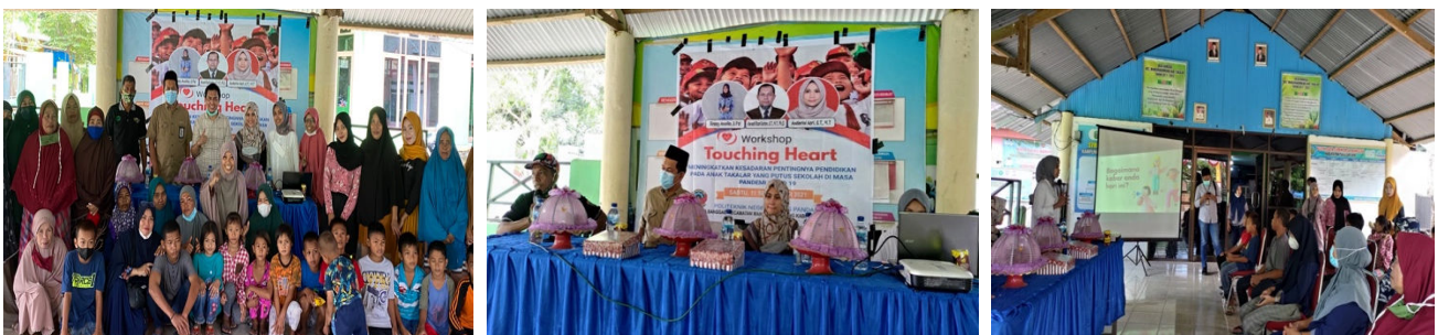
Gambar 5. Pelaksanaan Workshop Touching Heart