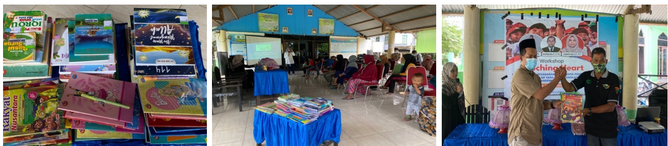
Gambar 8. Pemberian buku dan modul belajar paket A, B dan C pada pihak mitra

Modul pembelajaran persiapan ujian paket C dan TKDA. Modul ini akan kami bagikan dalam bentuk cetak maupun file agar seluruh peserta anak putus sekolah dapat dengan mudah melalui ujian paket C dan TKDA. Pemberian pelatihan yang baik terkait modul pembelajaran ini akan sangat membantu dan memberikan kepercayaan diri untuk melanjutkan pendidikan dengan mengikuti kelas reguler atau ujian Paket C (gambar 8).