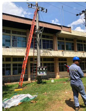
Perakitan LA & FCO