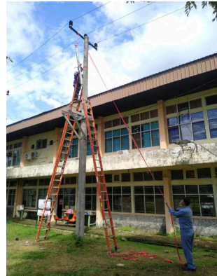
Pemasangan dudukan LA & FCO