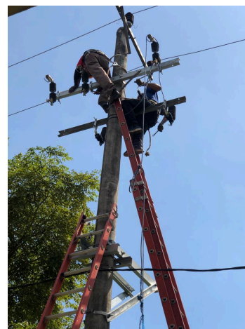
Pemasangan dudukan LA