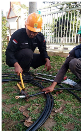
Pemasangan skun konektor A3CS