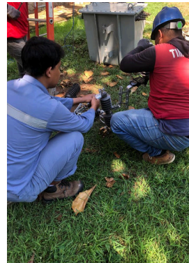
Perakitan LA & FCO