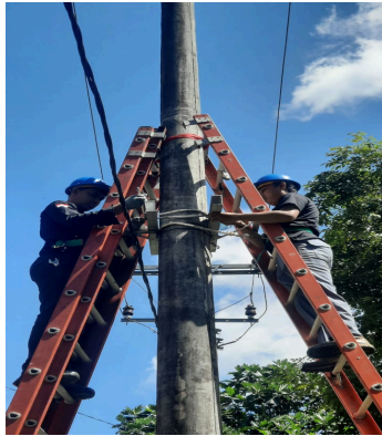
Pemasangan Dudukan Trafo

Proses pada tahap ini pemasangan peralatan utama gardu canto dapat dilihat pada gambar 2, 3 dan gambar 4 berikut :