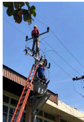
Pemasangan konduktor A3CS