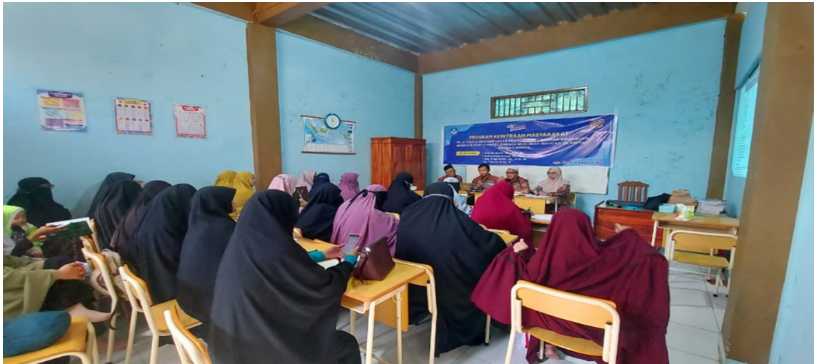
Gambar 3. Pelaksanaan pelatihan karakteristik laporan keuangan berdasarkan ISAK 35

Gambar 3 menunjukkan suasana pelaksanaan pelatihan tentang bagaimana karakteristik laporan keuangan berbasis ISAK 35. Dari hasil pelaksanaan kegiatan ini, mitra telah mendapatkan pengetahuan tentang standar yang digunakan dalam penyusunan Laporan keuangan untuk entitas yang berorientasi non laba yaitu ISAK 35 (Interpretasi standar Akuntansi Keuangan No. 35) revisi dari PSAK 45, yang mencakup Laporan Posisi Keuangan, Laporan penghasilan komprehensif, laporan perubahan aset neto, Laporan arus kas dan Catatan atas laporan keuangan.