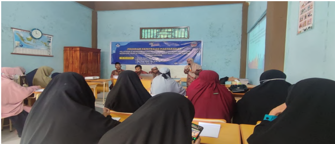
Gambar 2. Pelaksanaan pelatihan mengenai gambaran umum dan pentingnya laporan keuangan

Gambar 1 menunjukkan suasana pelaksanaan pelatihan mengenai Penataan organisasi kearah yang lebih baik. Dari hasil pelaksanaan kegiatan ini, mitra telah mendapatkan pengetahuan bahwa dalam melaksanakan suatu organisasi diperlukan PDCA yang merupakan Planning; organisasi membutuhkan suatu perencanaan, Do; Apa yang sudah direncanakan harus terlaksana dengan baik, Check; pelaksanaan kegiatan memerlukan pengawasan and Action merupakan tindak lanjut yang berarti seluruh prosesnya akan berulang lagi secara berkelanjutan.