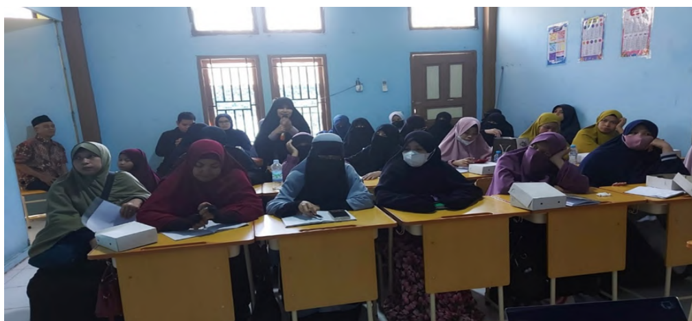
Gambar 6. Suasana kehadiran peserta pelaksanaan pelatihan penyusunan laporan keuangan menggunakan excel sederhana

Gambar 5 menunjukkan suasana pelaksanaan pelatihan tentang bagaimana melakukan penyusunan laporan keuangan non laba berdasarkan ISAK 35 dengan menggunakan excel sederhana, dari hasil pelaksanaan kegiatan ini mitra mendapatkan pengetahuan mengenai penyusunan laporan keuangan berdasarkan ISAK 35 yang sebelumnya peserta menggunakan pembukuan pencatatan kas masuk dan kas keluar.