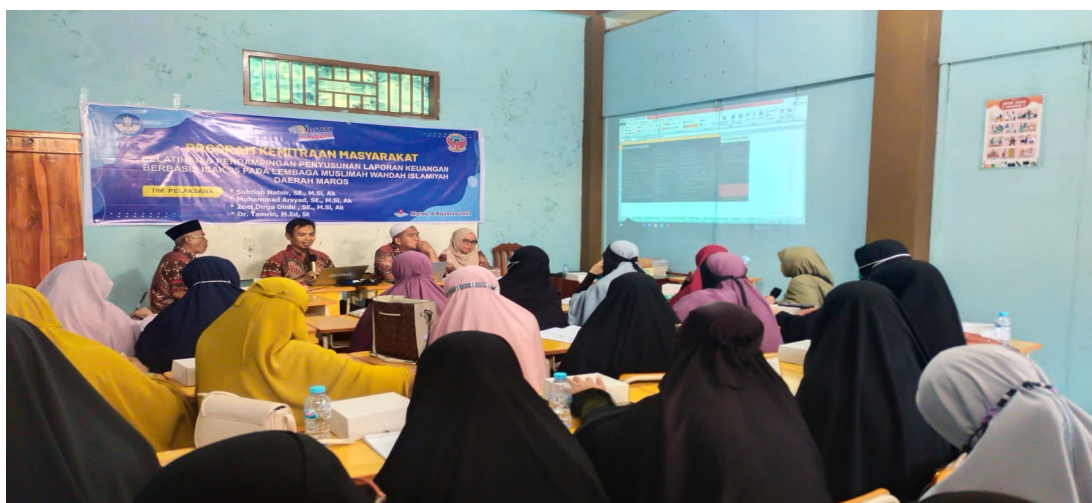
Gambar 4. Pelaksanaan pelatihan bagaimana melakukan penyusunan laporan keuangan menggunakan excel sederhana

Gambar 3 menunjukkan suasana pelaksanaan pelatihan tentang bagaimana karakteristik laporan keuangan berbasis ISAK 35. Dari hasil pelaksanaan kegiatan ini, mitra telah mendapatkan pengetahuan tentang standar yang digunakan dalam penyusunan Laporan keuangan untuk entitas yang berorientasi non laba yaitu ISAK 35 (Interpretasi standar Akuntansi Keuangan No. 35) revisi dari PSAK 45, yang mencakup Laporan Posisi Keuangan, Laporan penghasilan komprehensif, laporan perubahan aset neto, Laporan arus kas dan Catatan atas laporan keuangan.