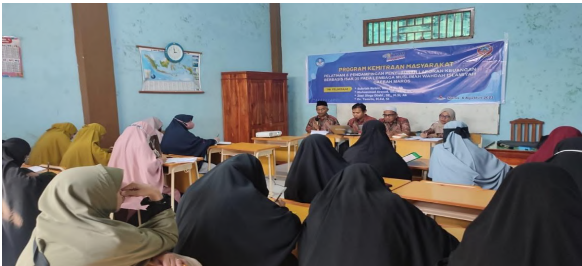
Gambar 1. Pelaksanaan pelatihan mengenai penataan organisasi kearah yang lebih baik

Keberhasilan ini selain diukur dari keempat komponen di atas, juga dapat dilihat dari kepuasan peserta setelah mengikuti kegiatan. Manfaat yang diperoleh peserta adalah dapat menyusun laporan keuangan Lembaga nonprofit dengan kualitas yang lebih baik dan diharapkan kualitas tersebut sudah mengikuti standar akuntansi yang berlaku umum yakni ISAK 35.